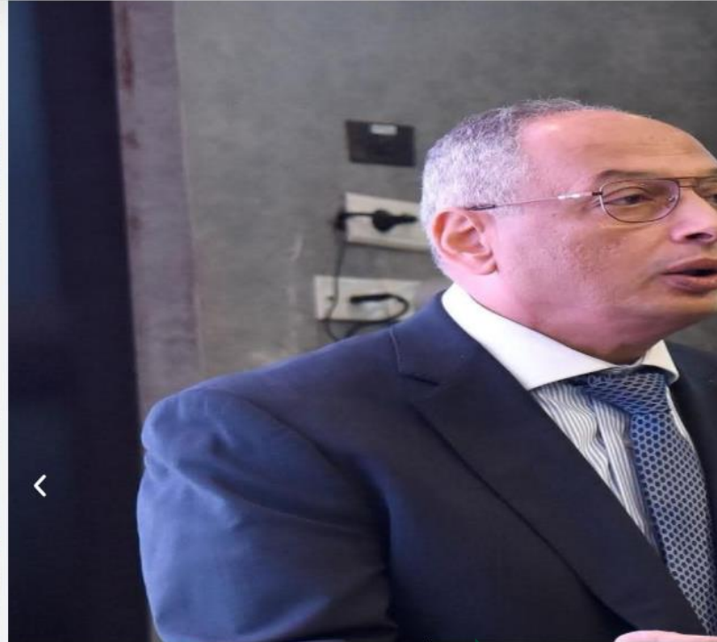
رقابة على الصادرات والواردات