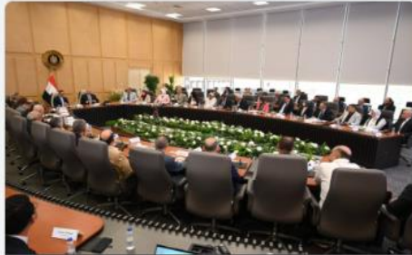
نائب رئيس مجلس الوزراء للتنمية