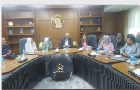
الهيئة العامة للرقابة على الصادرات والواردات تعقد...