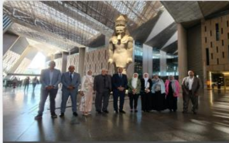
المتحف المصري الكبير (GEM) يحصل على تحقيق معتمد دو...