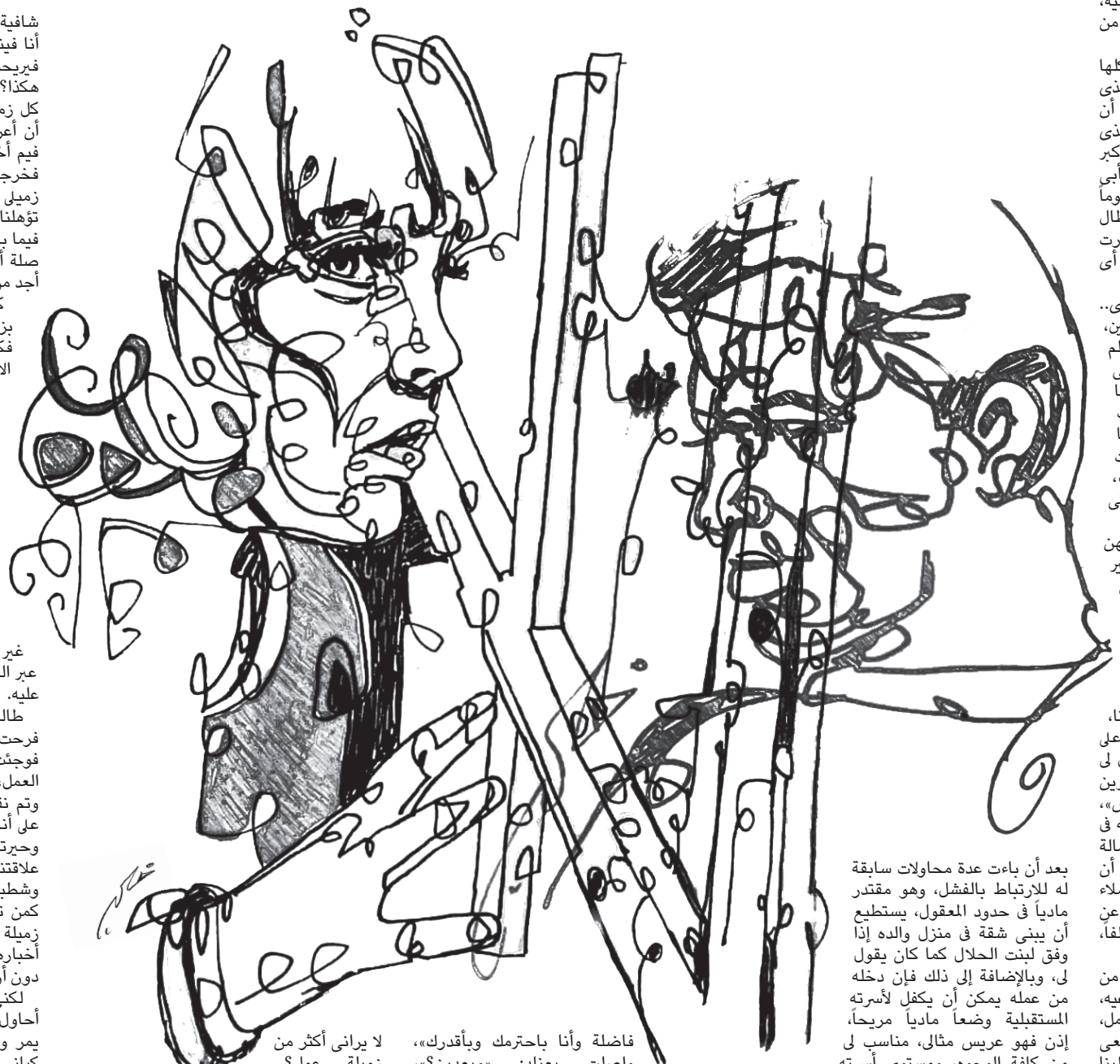
بعد أن باءت عدة محاولات سابقة له للارتباط بالفشل، وهو مقتدر مادياً في حدود العقول، يستطيع أن يبني شقة في منزل والده إذا وفق لبناء الحلال كما كان يقول

في، وبالإضافة إلى ذلك فإن دخله من عمله يمكن أن يكفل لأبنته المستقبلية وضعا مادياً مريحاً، إذن فهو عريس مثالي، مناسب لي