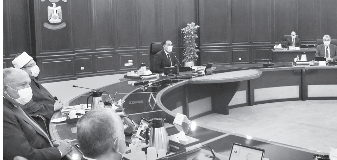
مجلس الوزراء خلال اجتماعه برئاسة «مدبولي» أمس

إلزام وحدات الجهاز الإداري للدولة والمحليات والمولات بالترشيد في كافة المباني والمرافق التابعة لها طوال ساعات العمل الرسمية