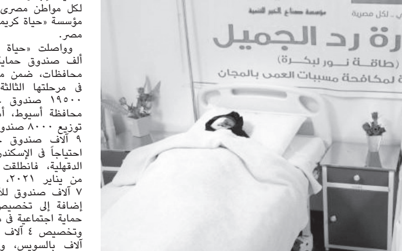
«حياة كريمة» أطلقت مبادرة «رد الجميل» في أبريل ٢٠٢١

بقرية جزيرة الشندويل بمحافظه سوهاج، في إطار جهود الدولة المتواصلة لتنفيذ إجراءات الحماية الاجتماعية لكل مواطن مصري، حيث وصل قطار مؤسسة «حياة كريمة» محطته في صعيد مصر. وواصلت «حياة كريمة» توزيع ٥٣ ألف صندوق حماية اجتماعية في عدة محافظات، ضمن مبادرة «رد الجميل» في مرحلتها الثالثة، حيث تم توزيع ١٩٥٠٠ صندوق حماية اجتماعية في محافظة أسيوط، أما في النيا فقد تم توزيع ٨٠٠٠ صندوق، كما تم تخصيص ٩ آلاف صندوق لحماية للأسر الأكثر احتياجاً في الإسكندرية، أما في محافظة الدقهلية، فانتقلت المبادرة في الثالث من يناير ٢٠٢١، حيث تم تخصيص ٧ آلاف صندوق للأسر الأكثر احتياجاً، إضافة إلى تخصيص ٥ آلاف صندوق لحماية اجتماعية في محافظة كفر الشيخ، وتخصيص ٤ آلاف لحافظة الفيوم، و٣ آلاف بالسيويس، و٢٠٠٠ صندوق في البحر الأحمر، وجاءت هذه المرحلة من مبادرة «رد الجميل» بعد الانتهاء من مرحلتين الأولى والثانية برعاية مؤسسة «حياة كريمة» في مختلف محافظات الجمهورية.