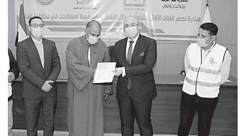
أحد المستفيدين من مبادرة «التصالح حياة»

جاءت مبادرة «التصالح حياة» كإحدى أذرع المبادرة الرئاسية «حياة كريمة»، التي تستهدف الإنسان بالدرجة الأولى، لتساعد الأسر الأكثر فقراً في سداد قيمة التصالح في مخالفات البناء، وذلك منذ أن أعلنت الحكومة المصرية فتح ملف التصالح في مخالفات البناء. وأدركت «حياة كريمة» حجم المشكلة من البداية، خاصة للفئات الأكثر فقراً، من خلال فرق الرصد الميداني الموجودة على أرض الواقع، وسارعت بتدشين «التصالح حياة» التي قررت في ٢٥ سبتمبر ٢٠٢٠ سداد قيمة المخالفات البنائية للمواطنين التي تأكدت المبادرة من عدم إمكانيةهم على سداد رسوم التصالح، وذلك دعماً لاستقرار المواطنين في منازلهم.