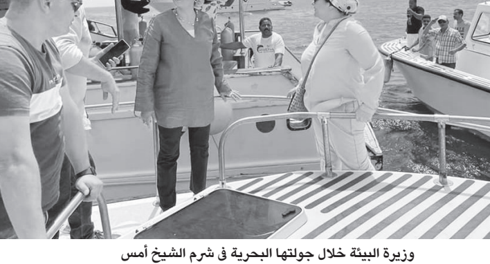
وزيرة البيئة خلال جولتها البحرية فى شرم الشيخ أمس

استخدام الأدوات البلاستيكية وعدم إلقاء المخلفات أو الأطعمة بالمياه وتجميع المخلفات وفصلها والالتزام بنظافة المكان، علاوة على الالتزام التام بالإجراءات الاحترازية، وشددت على ضرورة متابعة تنفيذ خطط الحفاظ على تنظيم نطاقات الزيارات بالمواقع، ما لذلك دور فى حماية التنوع البيولوجى بالحد من الضغوط البشرية على المنطقة لضمان استدامتها. وشددت على ضرورة الالتزام بالخرائط البحرية المنشورة لجميع السفنات البحرية بشرم الشيخ لضمان سلامة الحياة البحرية، وتوفير رحلة سياحية بحرية بيئية فريدة ومميزة للسائحين تساهم فى الحفاظ على البيئة مع الاستمتاع بالطبيعة كأحد مقومات السياحة البيئية المستدامة. وتفتقد «فؤاد» مركز السلام لمكافحة التلوث بالزيت، أحد المراكز المتخصصة فى مكافحة التلوث البحرى بالزيت فى مدينة شرم الشيخ، موضحة أنه تم عمل محاكاة لعملية فصل الزيت من المياه فى حالة وجود حوادث بحرية محتملة، كما تفتقد موقع تخزين المعادن فى ضوء الاستعدادات لاستضافة مصر لمؤتمر المناخ.