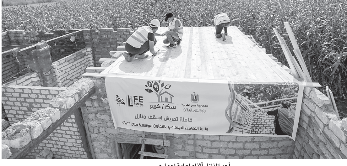
أحد المنازل أثناء إعادة إعمارها

رصد واقع القرى من خلال فرق عمل المؤسسة للوقوف على احتياجات الأهالي الحقيقية.. و٩٦٩ مليون جنيهه التكلفة خلال الفترة من ٢٠١٨ إلى ٢٠٢٠