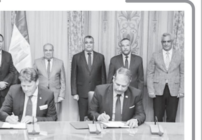
«مرسي» يشهد توقيع بروتوكول التعاون مع الشركة الألمانية أمس

كتب - محمد أبوعمرة: أكد الدكتور محمد عبدالعاطي، وزير الموارد المائية والري، أن حملة نظافة نهر النيل تهدف لحماية من التلوث والمخلفات البلاستيكية، والحفاظ على التنوع البيولوجي المائي، في إطار الاستعدادات الجارية لعقد أسبوع القاهرة الخامس للمياه والإعداد لفعاليات المياه خلال مؤتمر المناخ COP27، واستعداد أجهزة وزارة الموارد المائية والري أماكن انطلاق الحملات في نهر النيل، وتوفر المعدات اللازمة لحملة النظافة. جاء ذلك خلال متابعة الوزير الاستعدادات الجارية لتنفيذ حملة نظافة كبرى من المخلفات بطول مجرى نهر النيل ١٧ سيطر القبل بالتزامن مع الاحتفال باليوم العالمي للنظافة، الذي يُعد أكبر نشاط مدني لإزالة المخلفات في العالم ليوم واحد يشارك فيه أكثر من ١٩١ دولة. وأُعرب «عبدالعاطي»، وفقاً لبيان الوزارة، أمس، عن رغبته في مشاركة أكبر عدد ممكن من الشباب وطلبة المدارس في هذه الفعالية، في ضوء الوعي البيئي بمخاطر تلوث المياه، وتأكيد أهمية مشاركة منظمات المجتمع المدني بمختلف المحافظات، وعلى نطاق واسع، في هذه الفعالية المهمة. وأضاف أن نجاح مثل هذه الحملة سيكون بمثابة نموذج ناجح للتنسيق والتعاون بين الوزارات المعنية ومنظمات المجتمع المدني والقطاع الخاص يمكن تكراره مستقبلاً في مجال حماية الموارد المائية من مختلف أشكال التلوث. وتنفذ الحملة تحت رعاية وزارة الموارد المائية والري ووزارة التنمية المحلية ومؤسسة «شباب يتحب مصر» وإحدى الشركات الخاصة وعدد من المنظمات الدولية المعنية، وبمشاركة ١٦ محافظة ذات وجهة تيلية في فعاليتها من خلال قيام الأجهزة المحلية بهذه المحافظات بنقل المخلفات التي سيتم تجميعها للمدافن الصحية ومواقع تدوير المخلفات الصلبة.