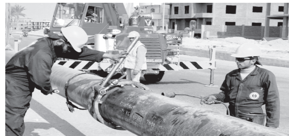
وزارة البترول تواصل مد القرى بالغاز الطبيعى

«الملا»: جاهزون لتوصيل الغاز لـ ٧٨٢ قرية أخرى.. ومد الخدمة إلى ١٥٠٠ وحدة سكنية بـ «جرجا» وتقسيم التكلفة على الفاتورة