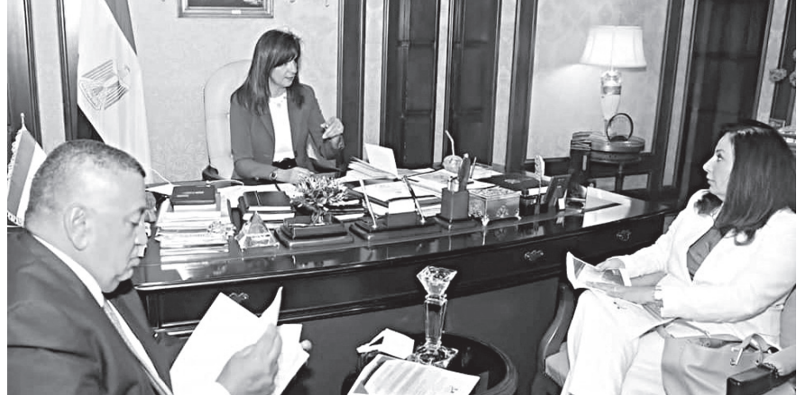
وزيرة الهجرة خلال أحد لقاءات بحث جلسات مؤتمر «الكيانات»

كتبت - مئة مدهد: أكدت السفيرة نبيلة مكرم، وزيرة الدولة للهجرة، أن جلسات مؤتمر الكيانات المصرية بالخارج، فى نسخته الثالثة، المقرر انعقادها الأحد المقبل بالقاهرة، ستعنى مناقشة واقية حول وثيقة التأمين للمصريين بالخارج، وما تقدمه من خدمات فى الشدة، إلى جانب الاستثمار العقارى والفرص التى تتيحها الدولة فيه، لافتة إلى أن هناك تعاوناً بين جميع مؤسسات الدولة لتلبية احتياجات المصريين فى الخارج، سواء فى مجالات الإسكان أو خدمات الهجرة، أو فرص الاستثمار، لتحقيق الاستفادة القصوى لهم وربطهم بالوطن. وأضافت «نبيلة»، خلال اجتماعها أمس، مع ممثل عدد من وزارات ومؤسسات الدولة، من بينها وزارة الإسكان وممثل اتحاد البنوك، للوقوف على الجلسات فى شكلها الأخرى، تنفيذاً لتكليفات القيادة السياسية، أن مصر حريصة على ربط أولادها بالوطن، وأن هناك