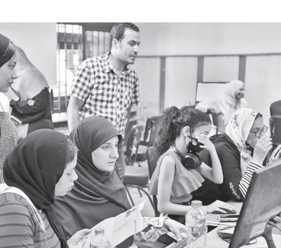
عدد من الطلاب أثناء تسجيل رغباتهم في اليوم الأول للتنسيق أمس

وأكدت وزارة التعليم العالي عن تقدم ٢٠ ألف طالب وطالبة لتسجيل رغباتهم حتى عصر اليوم الأول لتنسيق المرحلة الأولى. واستقبلت معاميل تنسيق جامعة القاهرة بمقرها بكليات الهندسة والزراعة والدراسات العليا للبحوث الإحصائية، طلاب الثانوية العامة لتسجيل رغباتهم إلكترونياً، وتقديم التسهيلات اللازمة والخدمات المطلوبة طوال فترة التنسيق. وأوضح الدكتور محمد عثمان النجدي، رئيس جامعة القاهرة، أنه تم الاستعداد مبكراً، حيث تم تجهيز المعامل لاستقبال أكثر عدد من طلاب الثانوية وأولياء أمورهم، مؤكداً أنه تم وضع خطة هذا العام لتنظيم عملية التسجيل داخل المعامل وخارجها لضمان سلامة جميع المترددين والوقوف، وتوفير أماكن مناسبة لانتظارهم لعدم التزاحم والتكدس، مع التوجه بتقديم التسهيلات اللازمة والخدمات المطلوبة. وأوضح «النجدي» أن المعامل الثلاثة معدة ومجهزة على أكمل وجه وتضم أجهزة حاسب آلي حديثة مزودة بالإنترنت وطابعات حديثة لطباعة