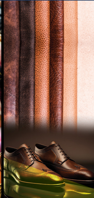
Footwear and Leather products