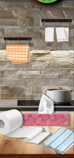
Paper and Paper products