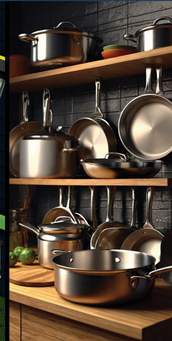
Cookware and Tableware

GOEIC Inspection Unit ISO/IEC 17020 : 2012