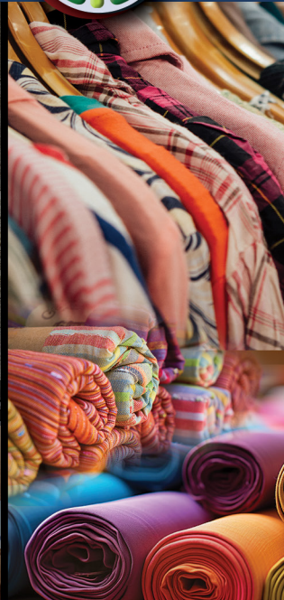
Textile & Garments